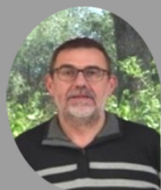
Maire d'Enquin lez Guinegatte